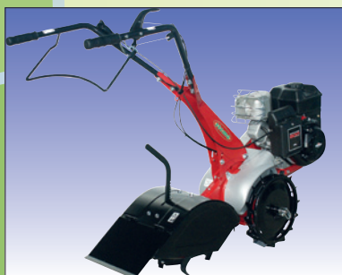
Option: Hacksatz 32 cm mit Stahlreiferrad

option: fraise 32 cm avec roue à griffes d'acier