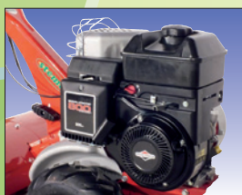
OHV Benzinmotor von B&amp;S

Abmessung / Dimensions L 145 cm, B 52 cm, H 102 cm