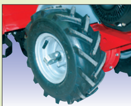
Breitreifen mit Freilaufschtaltung