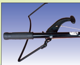
einfache Bedienung für vor- und rückwärts