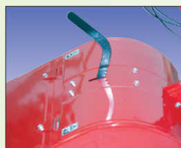
Einstellung der Arbeitstiefe