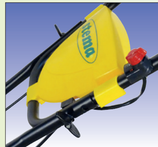
Handholmen 2-fach klappbar mancheron rabattable en deux