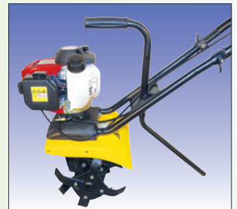
handlicher Tragegriff poignée pratique pour le transport