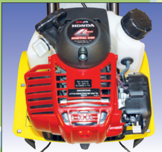
HONDA 4-Takt Motor moteur HONDA à 4 temps

Motor / Moteur HONDA GX25 1 PS OHV / cv Getriebe / Transmission Schneckenradgetriebe im Oelbad / par vis sans fin à bain d'huile Gänge / Vitesse 1 Vorwärtsgang / 1 marche avant Kupplung / Embayage Fliehkraftkupplung / embrayage centrifuge Handholmen / Mancheron 2-fach klappbar für Transport/ rabattable Arbeitsbreite / Largeur de travail 28 cm Arbeitstiefe / Profondeur de travail 18 cm Hacksatzdurchmesser / Diamètre de l'arbre de binage 22 cm Drehzahl / Vitesse de rotation 140 U/min. Gewicht / Poids ca. 12 kg / environ Handgriff / poignée für Transport / pour le transport Abmessung / Dimensions L 125 cm, B 28 cm, H 105 cm