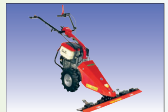
Mähwerk 97 cm zusätzlich Fr. 1'100.- Fauçonneuse 97 cm en plus