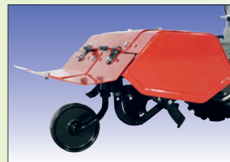
Transportrad für Bodenfräse roue de transport pour la fraiseuse