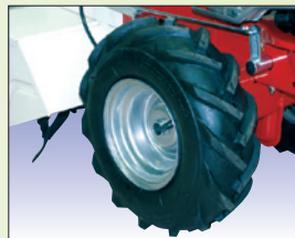
Breitreifen pneus larges