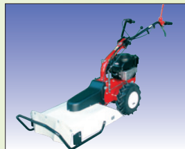
Sichel-Mulchmäher 55 cm débroussaillieuse 55 cm