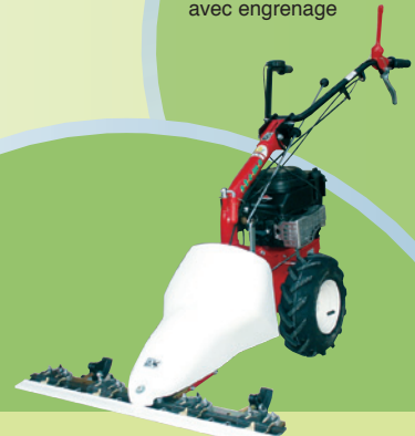
Mähwerk / Faucheuse 87 cm Fr. 450.-

...les motoculteurs à bas prix pour l'usage privé