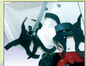
robuster Hacksatz mit Zahnradgetriebe entraînement par fraise robuste avec engrenage