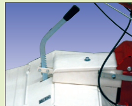
Einstellung der Arbeitstiefe réglage de la profondeur du travail