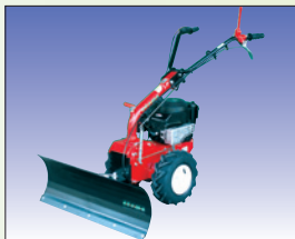
Schneeräumschild 85 cm chasse-neige 85 cm