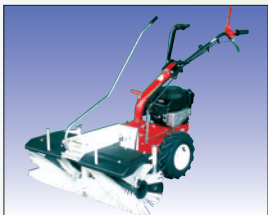
Kehrmaschine 105 cm mit/ohne Auffangbehälter balayeuse 105 cm avec/sans bac de ramassage