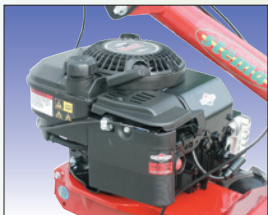
Benzinmotor von B&S moteur à essence B&S

Motor / Moteur B&S 675 6 PS / cv Getriebe / Transmission Zahnradgetriebe im Oelbad / par engrenages à bain d'huile Gänge / Vitesses 1 Vor- und 1 Rückwärtsgang / 1 marche avant et 1 marche arrière Geschwindigkeit / Vitesse d'avancement 1,2 / 2,4 km/h Kupplung / Embrayage über Keilriemen / par courroie trapézoïdale Bereifung / Pneus 13x5.00-6 Breitreifen / pneus larges Handholmen / Mancheron seiten-/höhenverstellb., wendbar 180°/réglable en hauteur/latéralement, réversible 180° Arbeitsbreite / Largeur de travail 50 cm Gewicht / Poids mit Bodenfräse ca. 75 kg / environ avec la fraise Abmessung / Dimensions L 145 cm, B 55 cm, H 102 cm