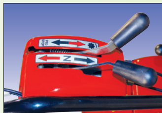
einfache Schaltung passage aisé des vitesses marche avant et arrière