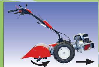
umgekehrte Drehrichtung der Fräse sens de rotation inverse de la fraise