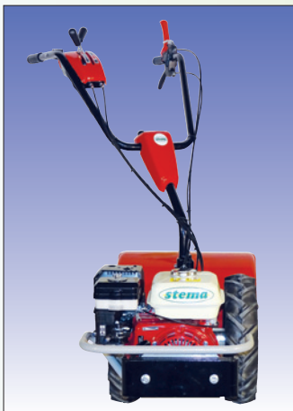
Holmen Schnellverstellung réglage rapide du mancheron

Abmessung / Dimensions L 156, B 51, H 80 cm