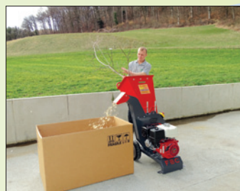
hoher Auswurf éjection haute