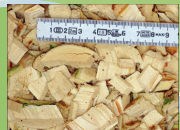
Häckselgut débris broyés