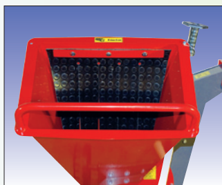
großer Einfülltrichter grande trémie