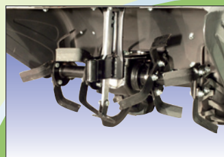
Hacksatz mit geschmiedeten Messern