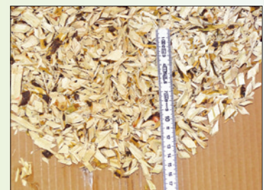
Häckselgut débris broyés