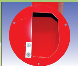
auswechselbare Gegenschneide am Einfülltrichter contrecouteau interchangeable à la trémie