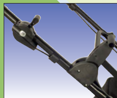
Schnitttiefeinstellung am Handholmen

réglage de la profondeur de coupe au mancheron