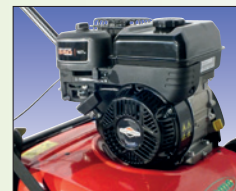
B&S Motor OHV