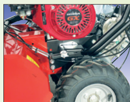
Höhenverstellung der Holmen

tous les éléments réglables au mancheron