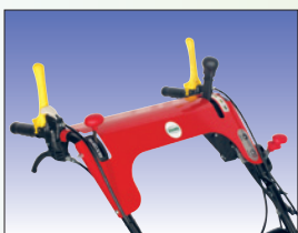
alle Bedienungselemente am Holmen

Abmessung / Dimensions L 160 cm, B 75 cm, H 100 cm