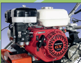
HONDA-Motor moteur Honda OHV

Abmessung / Dimensions L 163 cm, B 63 cm, H 97 cm