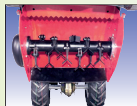
freischwingende Y Messer couteaux Y à oscillation libre