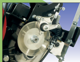
Scheibenbremse frein à disque