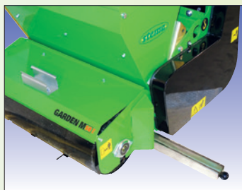
Wanne für Test bac de test