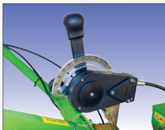
Einstellung Sägut réglage de semence

Motor / Moteur HONDA GX100 2.8 PS / cv Getriebe / Transmission 1 Vorwärtsgang / 1 marche avant Parkbremse / Frein de stationnement Ja / Oui Lenkung / Direction über geteilte Walzen / par des rouleaux séparés Antriebswalze / Rouleau d'entraînement selbstreinigend / autonettoyant Arbeitsbreite / Largeur de travail 58 cm Saatgutbehälter / Récipient à graines 40 Liter / litres Mischung / Mélange mit Perlonbürste / avec un balais perlon Dosierung / Dosage mit Handhebel / avec levier à main Gewicht / Poids 135 kg Abmessung / Dimensions L 145, B 67, H 105 cm