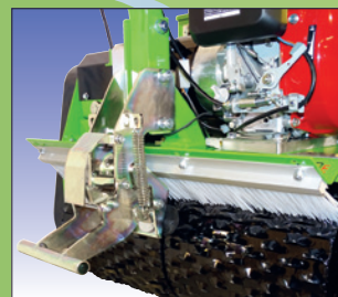
Parkbremse frein de stationnement