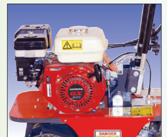
Honda – Motor moteur Honda