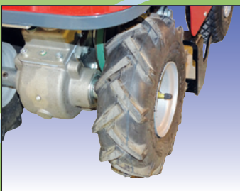
Griffige Bereifung pneus antidérapants

Abmessung / Dimensions L 76, B 40, H 115/74 cm