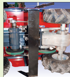
starkes Messer couteau robuste