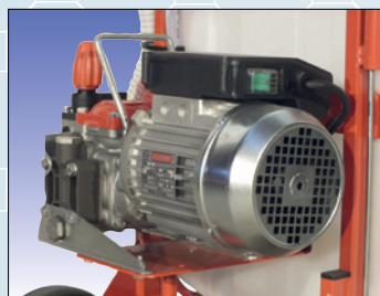
Elektromotor 230 V

Abmessung / Dimensions L 65 cm, B 55 cm, H 95 cm